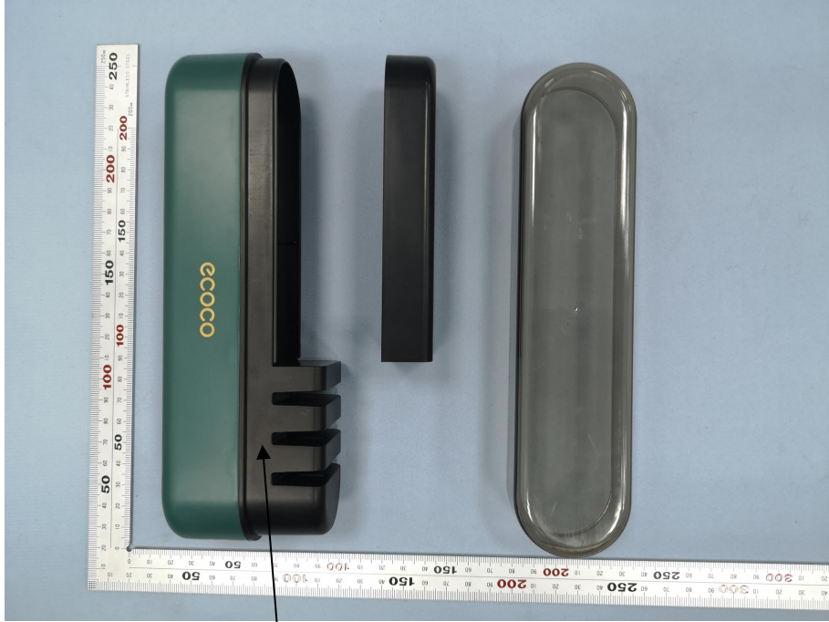
本次测试部位 (黑色中架)