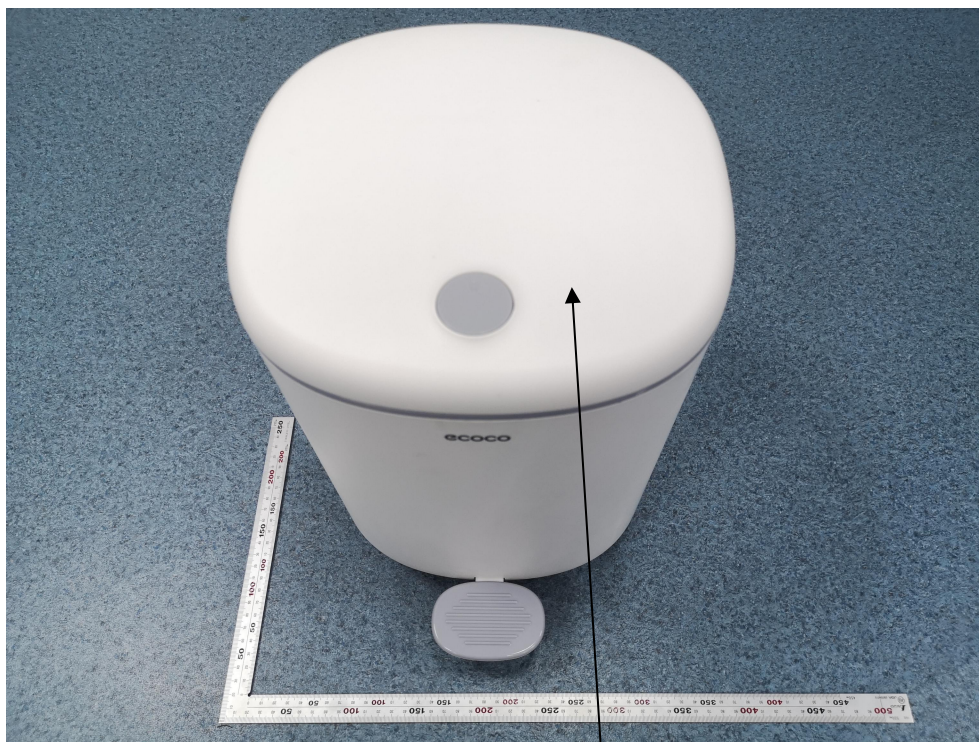
本次测试部位 (白色盖子)