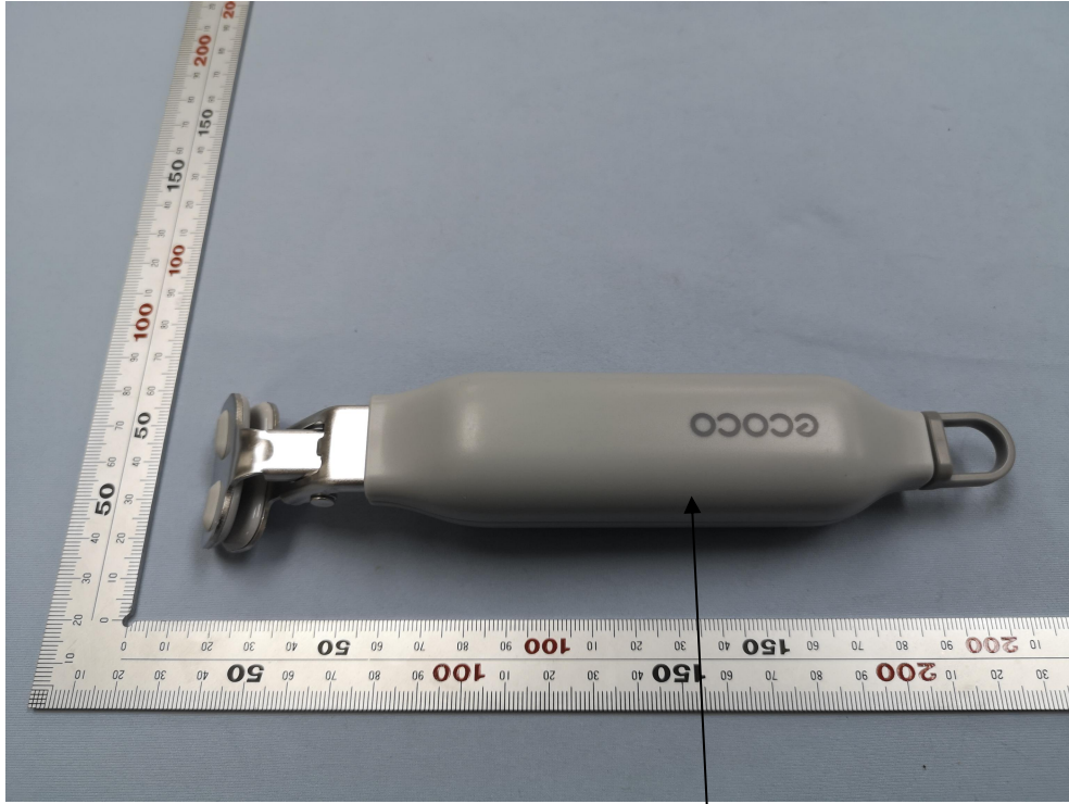
本次测试部位 (灰色塑料手柄)